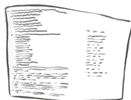
treści przeznaczone dla nauczyciela

1 Publikacja została tak zaprojektowana, aby jednocześnie mogli korzystać z niej nauczyciel i dzieci.